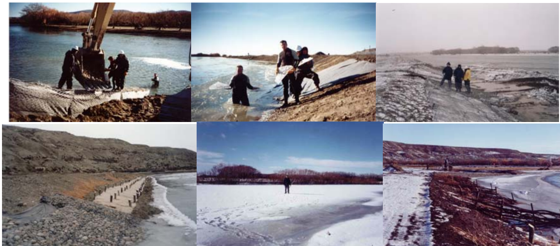
FOTOS OBRA AÑO 2002